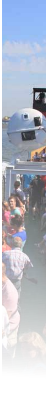
▲ AG EMS | 5 OKTOBER 2012 WERKBEZOEK COMMISSARIS VAN DE KONINGIN MAX VAN DEN BERG