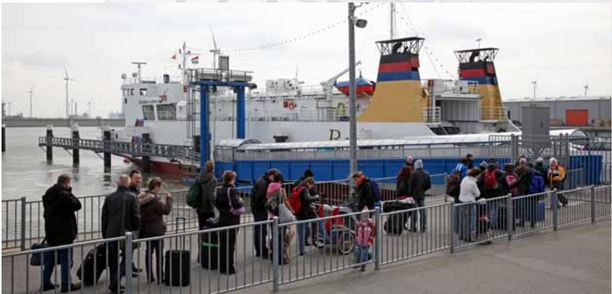
▲▲ AG EMS | 20 MAART 2012 TERMINAL BORKUMLIJN