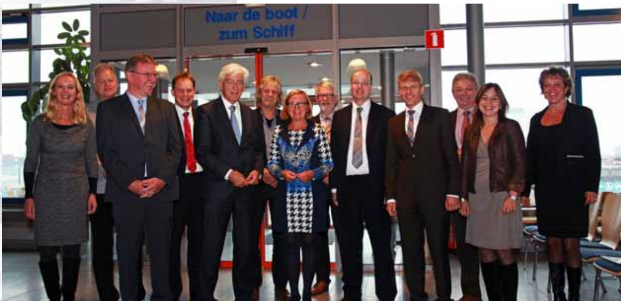
▲▲ AG EMS | 17 SEPTEMBER 2012 ONTMOETING CELEBRITY REFLECTION