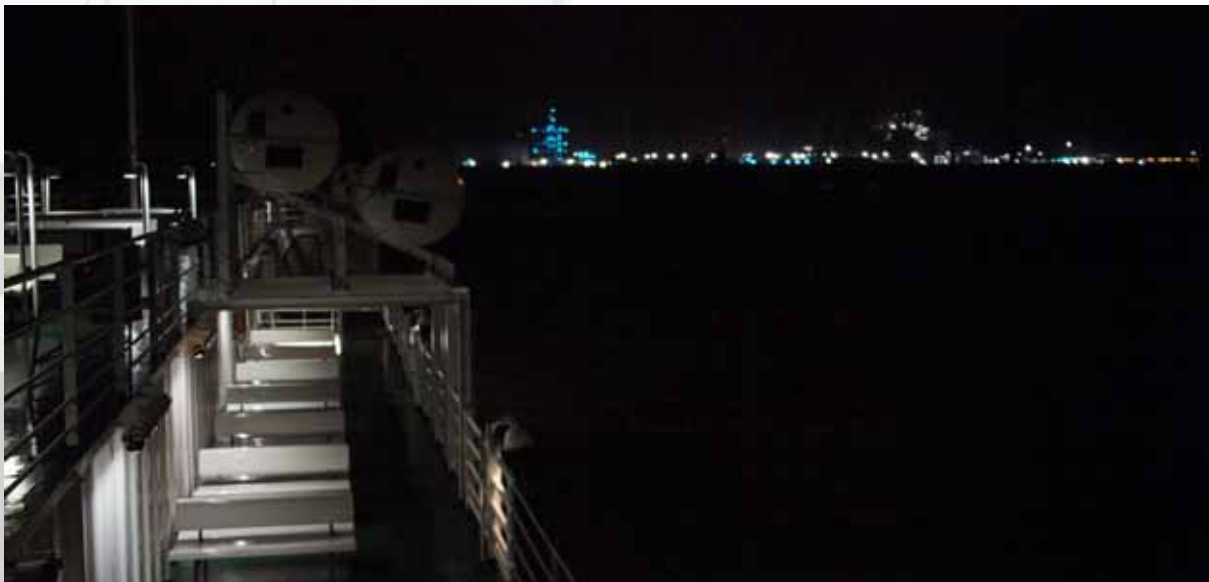
▲▲ AG EMS | 15 FEBRUARI 2012 NAAR BORKUM