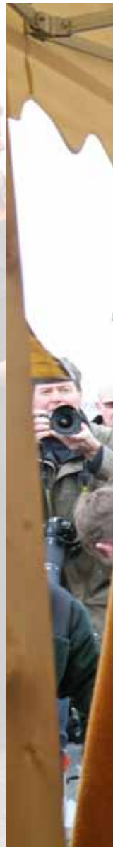
▲▲ AG EMS | 18 APRIL 2008 OPENING DOOR KONINGIN BEATRIX