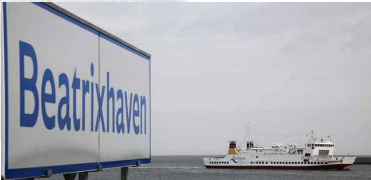
▲▲ AG EMS | 12 AUGUSTUS 2012 VEERBOOT MS GRONINGERLAND