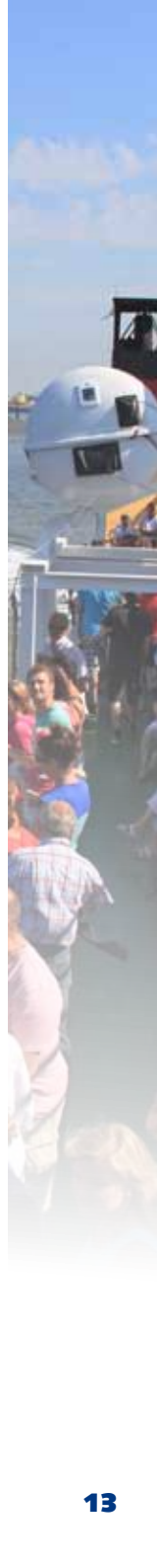
▲ AG EMS | 9 APRIL 2008 BOUW TERMINAL