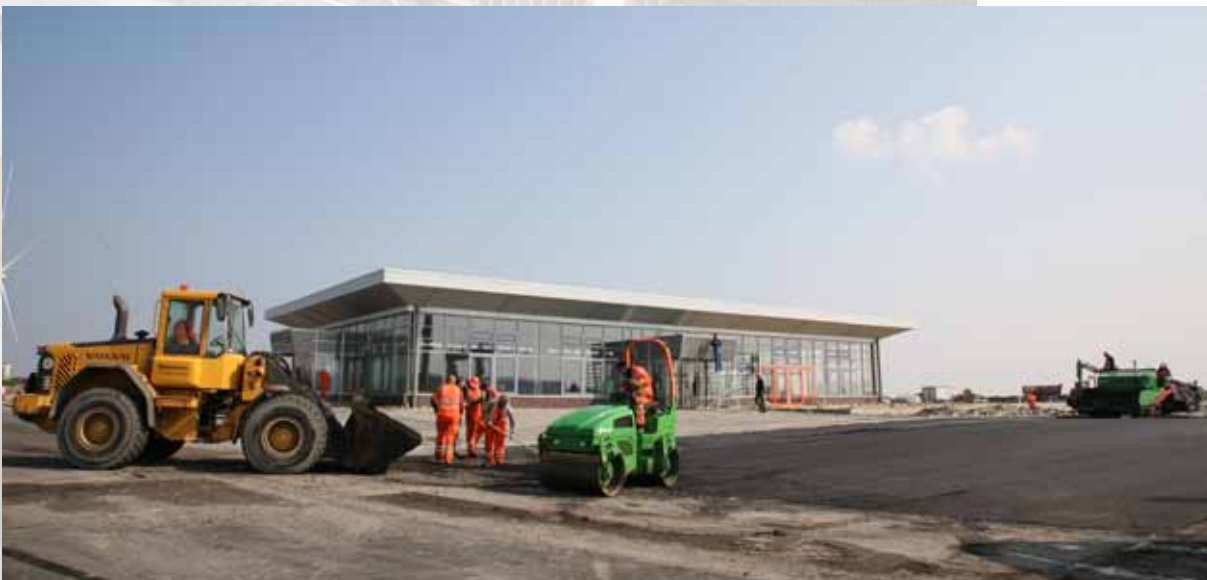
▲▲ AG EMS | 19 JUNI 2007 BOUW KADE