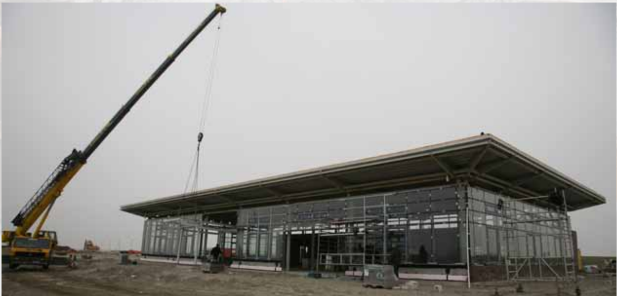
▲▲ AG EMS | 14 MEI 2007 BOUW KADE