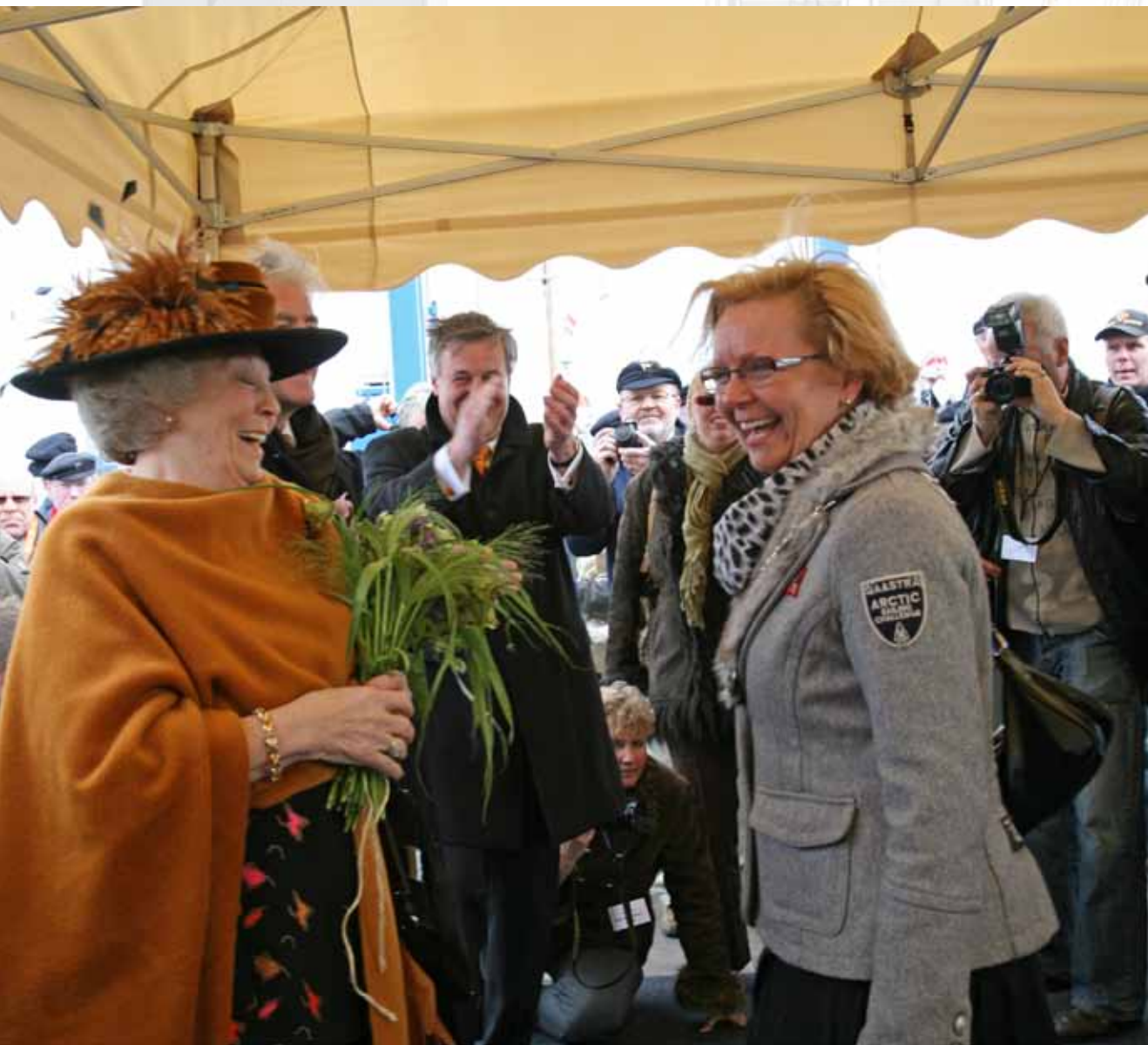
▲ AG EMS | 18 APRIL 2008 OPENING DOOR KONINGIN BEATRIX